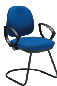
accotoirs fixes ⑤ MO VH1N + col.