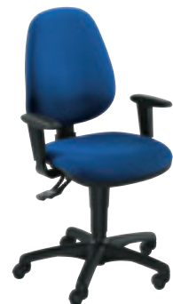
accotoirs réglables en hauteur ③ MO GHP2N + col.