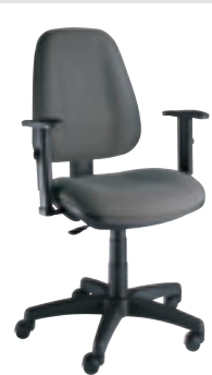
accotoirs réglables en hauteur ③ N1 GHP2N + col.