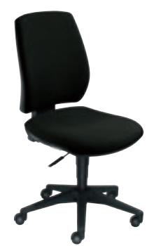
① TE GHP0 G ou N + col.