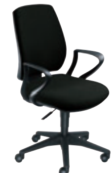
avec accotoirs fixes ② TE GHP1 G ou N + col.