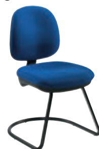
④ MO VH0N + col.