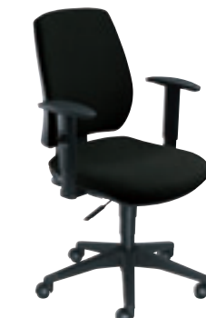
avec accotoirs réglables en hauteur ③ TE GHP2 G ou N + col.