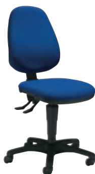
① MO GHP0N + col.