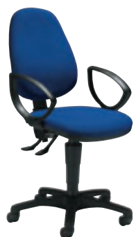
accotoirs fixes ② MO GHP1N + col.