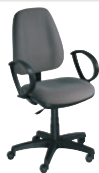
accotoirs fixes ② N1 GHP1N + col.